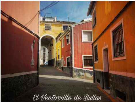
Arco Plaza Vieja (Bullas)