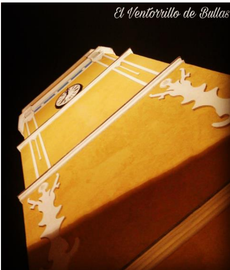
Torre del Reloj (Bullas)