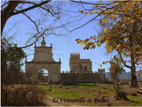
Palacete de Fuente Higuera, La Copa de Bullas (Bullas)