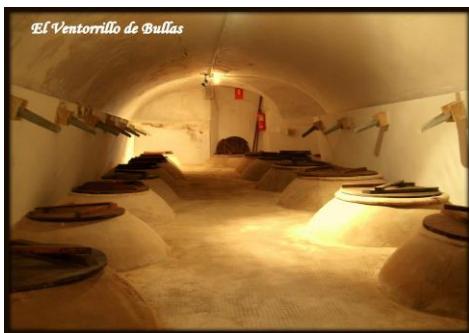
Museo del Vino (Bullas)