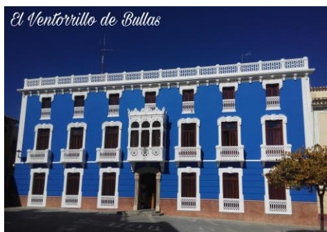
Casa de la Cultura (Bullas)

Y en el Asunto del correo -Inscripción Concurso Fotográfico Patrimonio de Bullas-