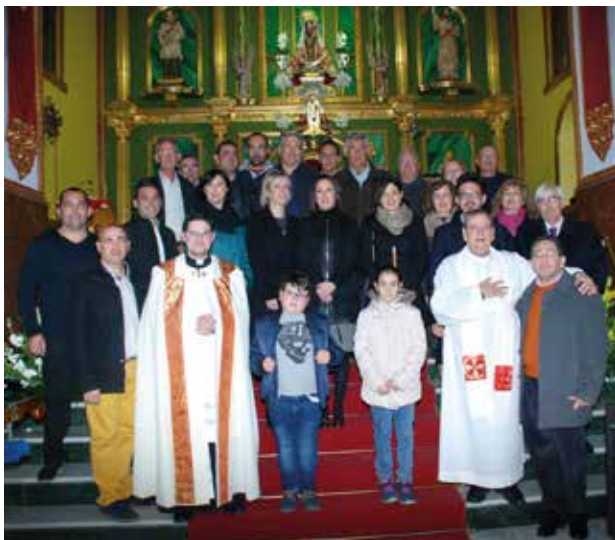
Comisión de San Antón 2018